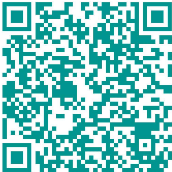
Landing Page (Portuguese)